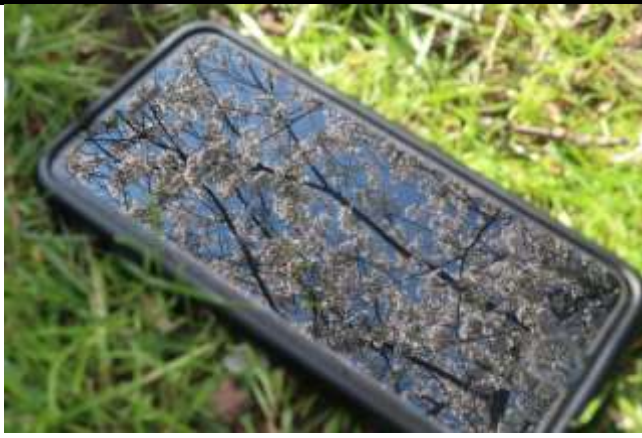
Fig 5. 瑞典的美麗櫻花