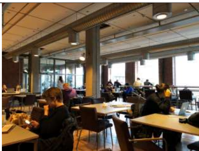
Fig 1. Chalmers 有很多空間讓你自由做事

在 Chalmers 應該幾乎不管什麼課都喜歡有分組作業，是一個讓你能夠認識人的機會，另一方面也會讓你有多一些關於這堂課的壓力。之前提到過的，因為每堂課都壓縮在兩個月，所以如果是主科的話，他的課程會滿重的，建議看清楚評分方式後，挑選幾個合宜的課程，在開學的第一個禮拜完成加退選！