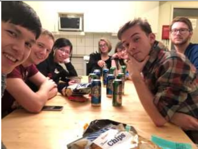
Fig 5. 邀請朋友一起來家裡煮飯