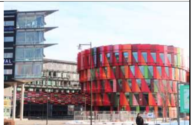
Fig 4. 美麗的Lindholmen 校區