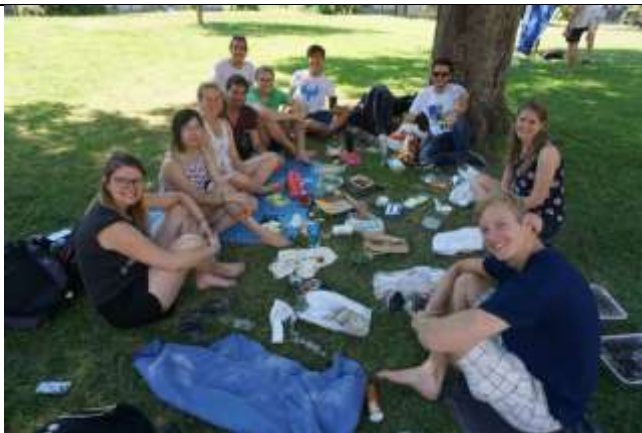
Fig 3. 歐洲人很愛野餐曬太陽