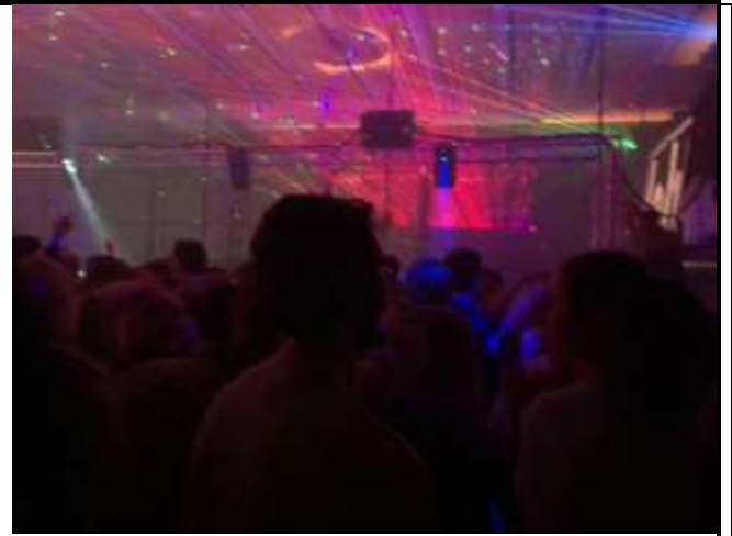
Fig 6. Chalmers Festu party