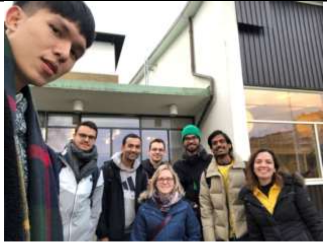
Fig 4. Chalmers 交換學生社 Circ 所分的小組