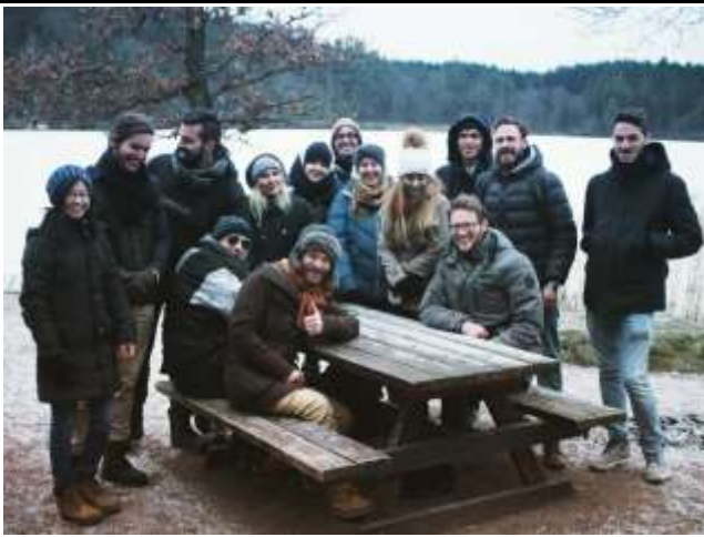
Fig 3. 第一個禮拜住青旅時一起去湖邊烤肉