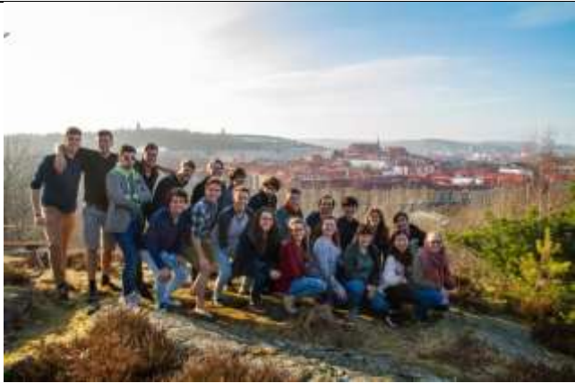
Fig 1. 與哥德堡大學的朋友拍照

出來一趟跟許多國家的人聊天之後才知道，其實每個國家或多或少都有自己的問題，並沒有一個完美的地方，很多被外人推崇的制度其實在當地也會面臨改革的需要。談論政治議題，也是一個大家常常好奇的內容，尤其台灣是個小國家，很多人對台灣也不是很了解，對歷史和政治環境有所認識，不只可以跟其他人討論很久，也可以順便讓大家認識台灣這個國家，做點國民外交！政治參與是全部公民都需要做的事，對政治冷感就是讓壞的人統治自己，尤其在歐洲民主如此發展的地方，大家時不時就是討論社會議題，抱怨政治現況而對改變有所冀求我認為算是全球的趨勢吧！來到歐洲，看見那麼多古老建築，自然而然的就慢慢對歷史有所興趣與認識了，多參加走路團，多跟人聊聊，認識世界也認別人認識你和台灣吧！