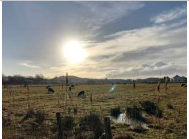
Fig 6. 哥德堡車程一小時的小島冬天景色