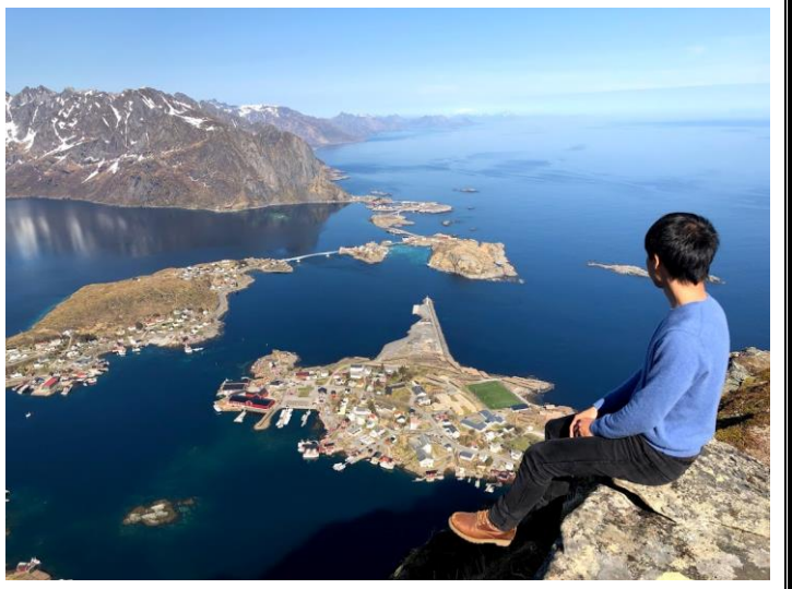
挪威—Reinebringen 俯瞰 Reine 小鎮