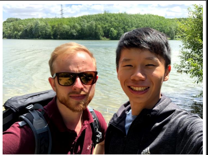
德國科隆—拜訪室友